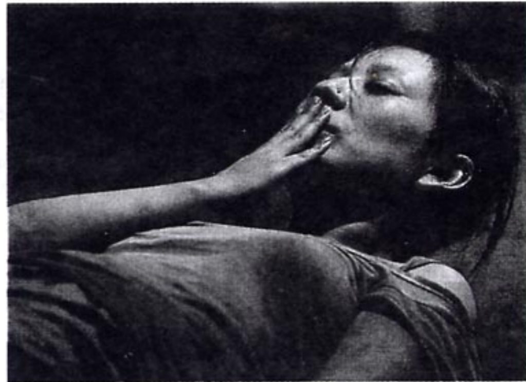
Outlanders sind Menschen wie scheue Tierchen.

Zuletzt tragen alle Plastiktrichter wie Hunde, die ihre Wunden nicht auflecken sollen, und lächeln so stoisch, wie wir Langnasen es von Asiaten erwarten.